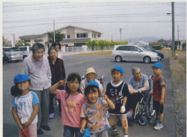
なごみ保育園児と交流会