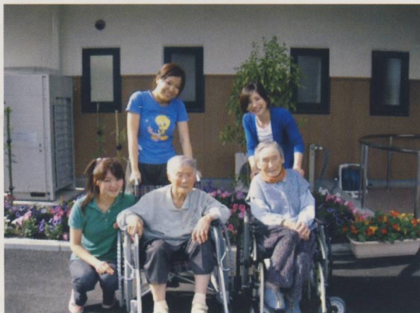
施設のやさしい若い人と

● ユニット型ケアの提供:できるだけ、一人ひとりの「どう生きたいか」にスポットを当てて、個別の対応をしていきます。個室をご用意し、使い慣れた家具や写真などに囲まれた生活ができます。食事や入浴など家庭的な雰囲気の中でのサービスを提供していきます。