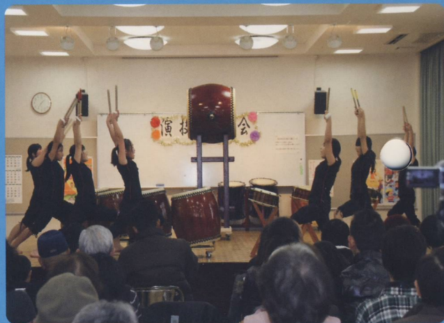
同時出演の北星太鼓(北星中学) 力強い太鼓の音が場内に響く