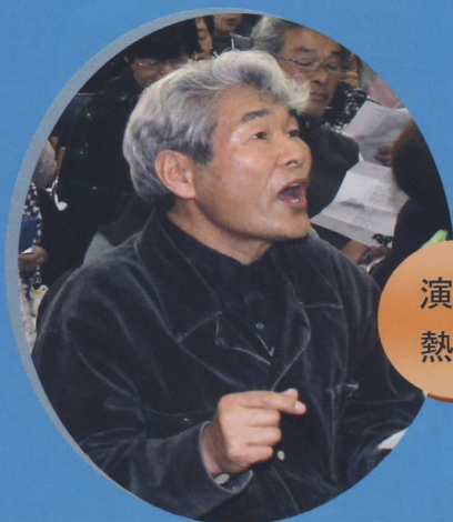
演奏曲に合わせて 熱唱される来場者