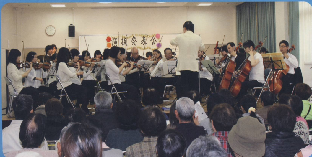
オーケストラ・アンサンブル 青い風の素晴らしい演奏風景