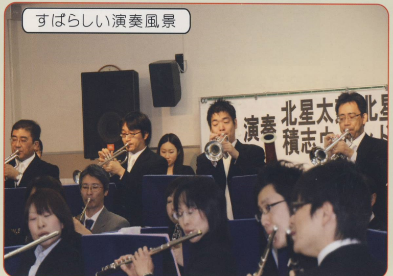
すばらしい演奏風景