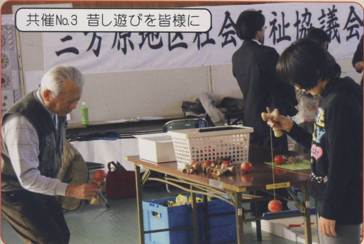
共催No.3 昔し遊びを皆様に