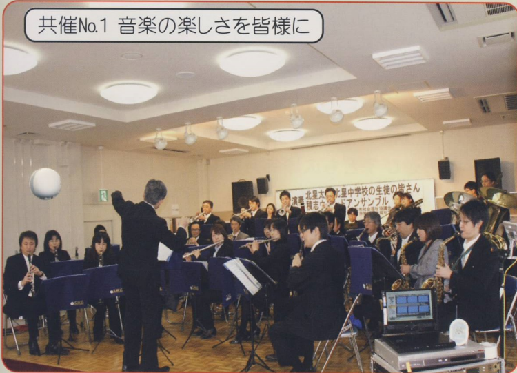
共催No.1 音楽の楽しさを皆様に