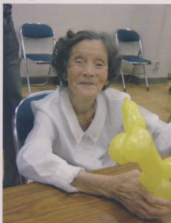
バルーンで犬?出来たかな?