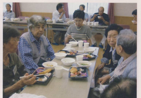
昼食時にも話しが弾む