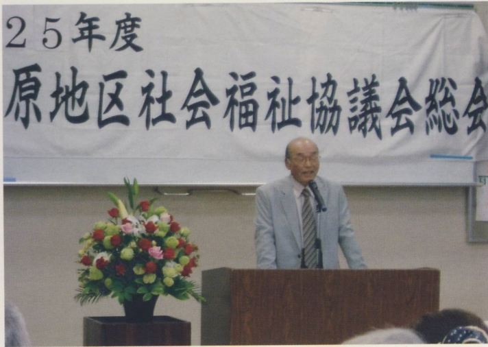
小倉会長 新任のあいさつ