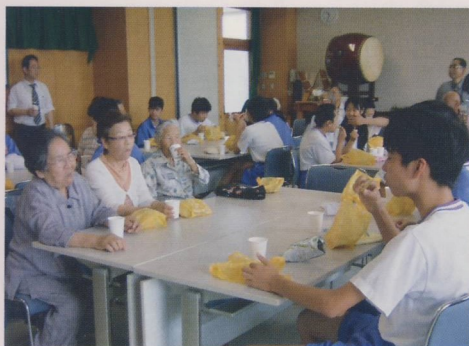
生徒さんたちと話し合う