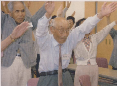
まずは健康体操から