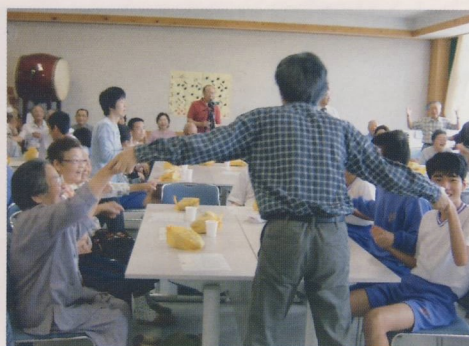
部会長の歌唱指導で手を繋ぐ高齢者と生徒