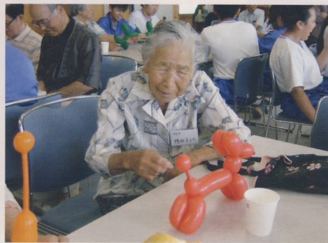
バルーン作りを楽しむ