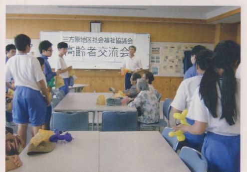
先生のあいさつのあと退席する生徒