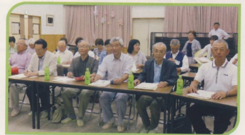
報告を聞く研修会参加者

研修では、安城市西部地区社協傘下の「町内福祉委員会」による活動、町内会での「世話焼きさん」の選定や、地域活動経験者の「公民館協力員」への人材活用などが機能して、先進的、継続的な素晴らしい地域福祉活動の様子が報告されました。